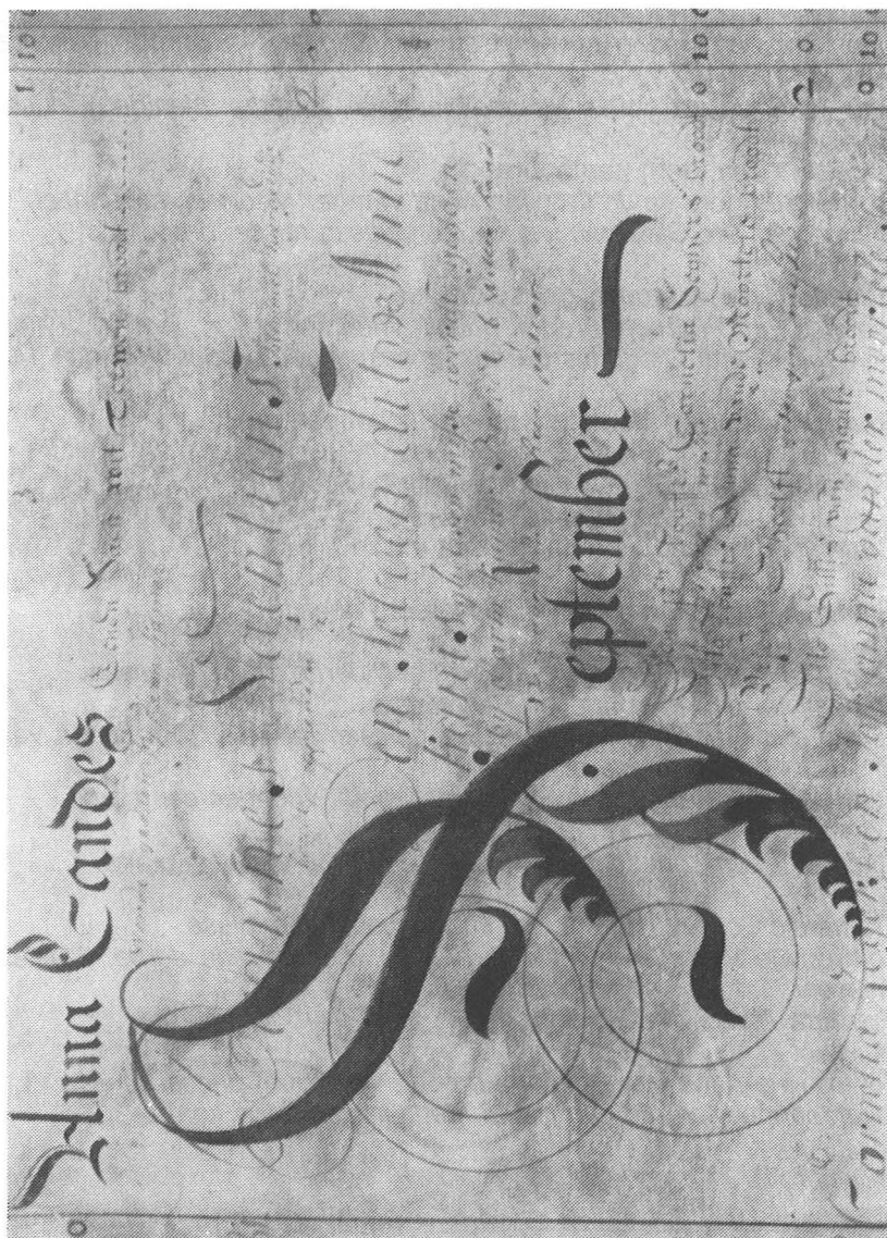
Fragment van de "Jaarrol der godvruchtige fundaties" met sierletter S(eptember).